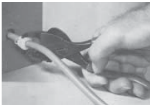
Réf. : R29